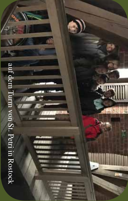
auf dem Turm von St. Petri in Rostock