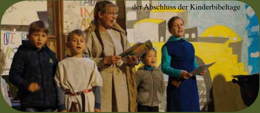
der Abschluss der Kinderbibeltage